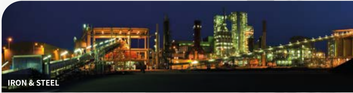
IRON & STEEL