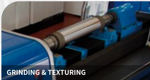
GRINDING & TEXTURING

负责任的、可靠和环保的创新解决方案。这种在创新上的专注，使得我们一直具有活力。如何去做？从分析市场趋势到参与国家和国际集团研究项目，在关键行业组织中扮演主角的角色，掌握重要的金属和采矿行业趋势。